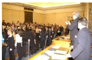
Ovation pour les diplômés