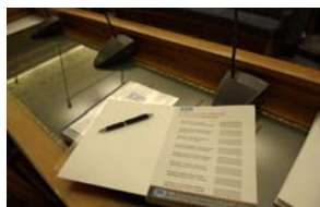
Le livret d'accueil 2005/06